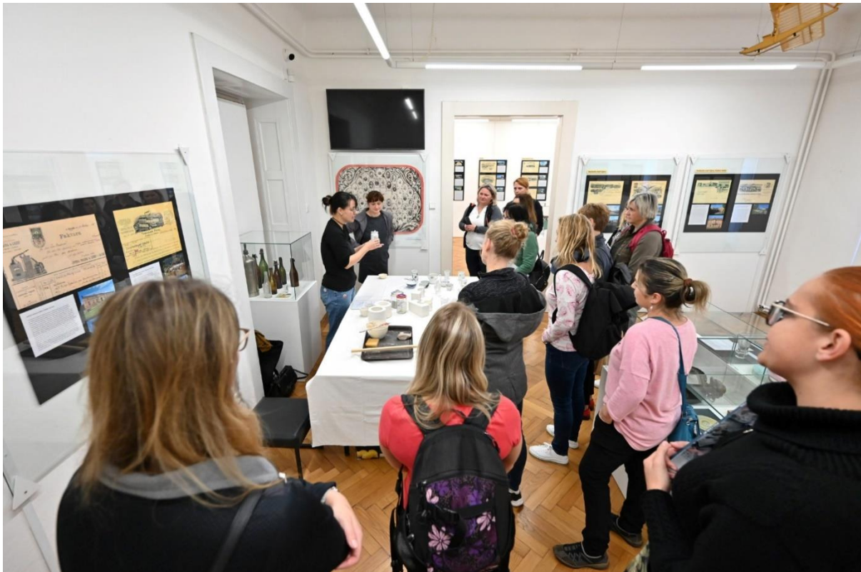
Ukázka odlévání porcelánu při jednání zástupců infocenter Krkonoš v Žacléři 24. října 2023 a prohlédnutí turistického cíle - památníku J. A. Komenského v Černé Vodě