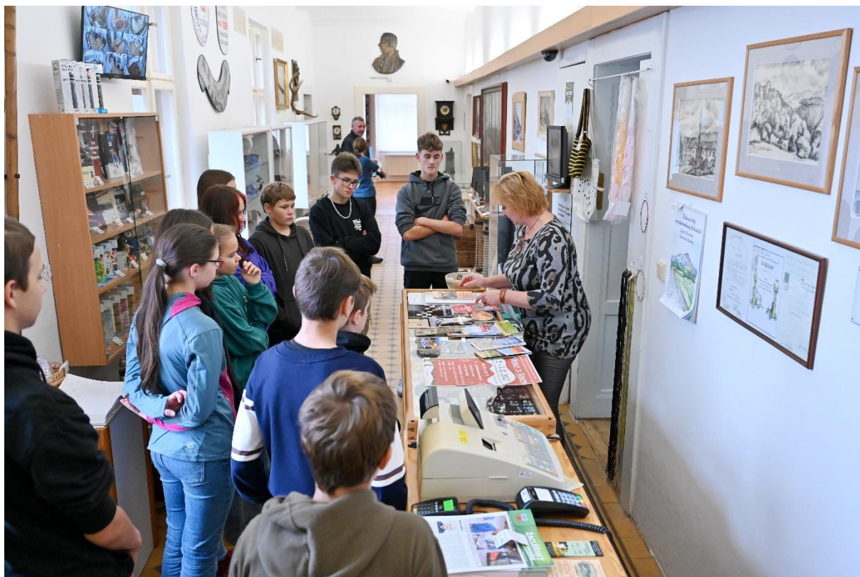
Návštěva žáků 8. tříd žacléřské základní školy 17. října 2023 za účelem seznámení se s prací zaměstnanců infocenter